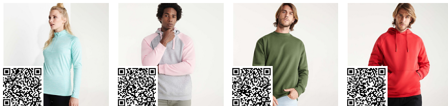
MELBOURNE WOMAN CA1114