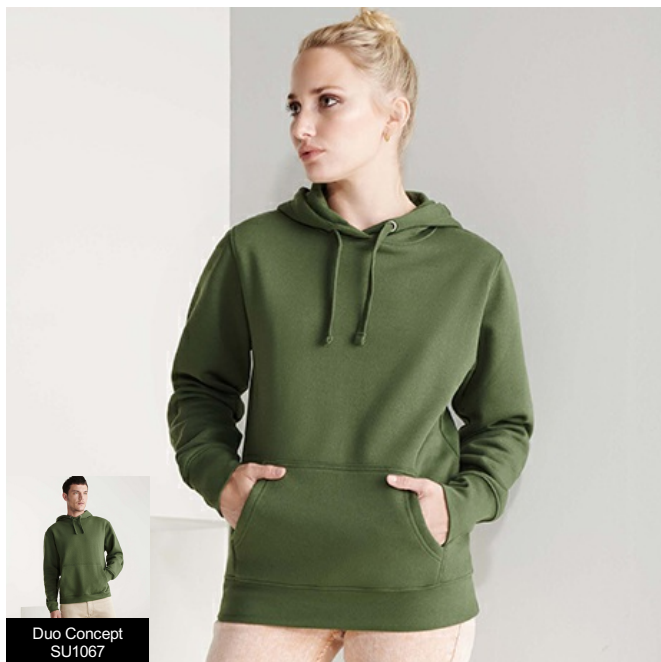
Duo Concept SU1067