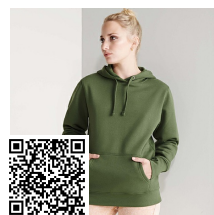
URBAN WOMAN SU1068