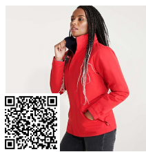
EUROPA WOMAN PK5078