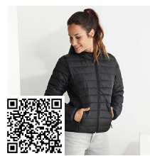
NORWAY WOMAN RA5091