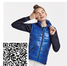
MONTANA WOMAN RA5084