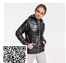
GROENLANDIA WOMAN RA5082