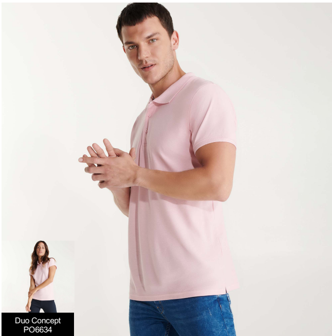
Duo Concept PO6634