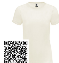
BASSET WOMAN CA6686