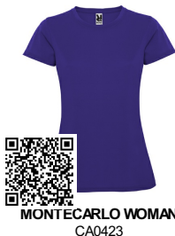
MONTECARLO WOMAN CA0423