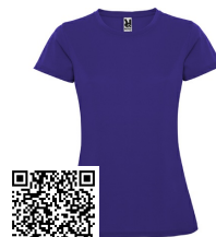
MONTECARLO WOMAN CA0423