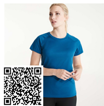
BAHRAIN WOMAN CA0408