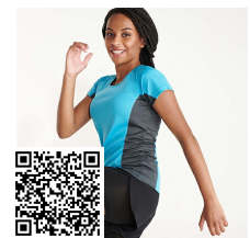
SHANGHAI WOMAN CA6648