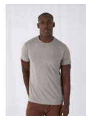
DUO CONCEPT mit B&C Organic Inspire T /men