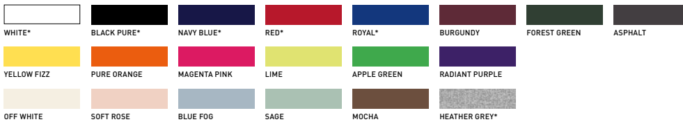
HEATHER GREY: 90% EINLAUFVORBEHANDELTE RINGESPONNENE, GEKÄMMTE OCS-BIO-BAUMWOLLE - 10% VISKOSE